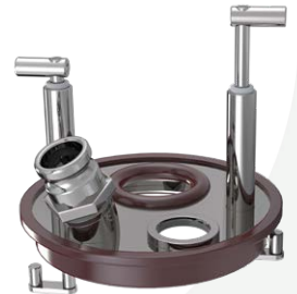
TAMPAS DE CAPTAÇÃO DE VAPOR