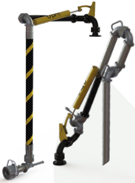
BRAÇOS DE CARREGAMENTO